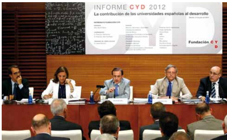
“Informe CYD 2012” txostena aurkezteko ekitaldia

Azken bederatzi urteotan, CYD Fundazioak Espainiako Estatuko unibertsitateek garapenari egin dioten ekarpena aztertu du. Beraz, unibertsitate-sistemaren egoera gainbegiratu ondoren, honako ondorio hauek atera ditu 2012ko CYD Txostenean: